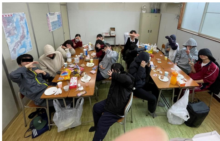
目隠しはセルフサービスでお願いしました。1人だけ隠せていない！